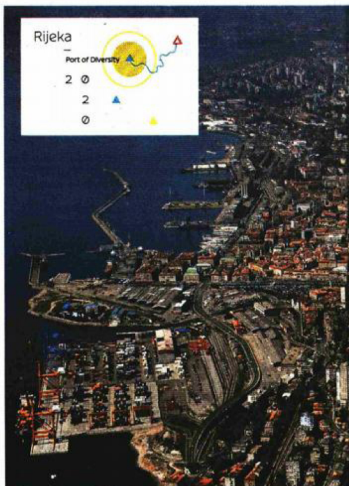
Kultura kao zamašnjak razvoja – panorama Rijeke

Struktura financija programskog dijela u prijavnju